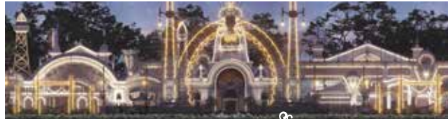
Découvrez l'Exposition Internationale de l'Est de la France de 1909 reconstituée virtuellement