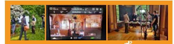
PARCOURS IMMERSIF ART NOUVEAU Vivez une expérience sensorielle et émotionnelle