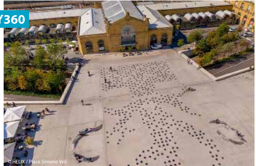
© HELIX / Place Simone Veil

Visit Nancy 360 a été réalisé par la société HELIX.