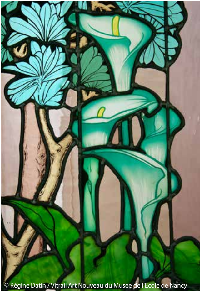
© Régine Datin / Vitrail Art Nouveau du Musée de l'Ecole de Nancy

Dans le cadre de la journée internationale de l'Art Nouveau, la Ville de Nancy organise les 11 et 12 juin prochains, un week-end dédié à ce mouvement. Pour l'occasion, DESTINATION NANCY s'associe à la programmation et propose de nombreuses visites guidées gratuites et pour tous à partir du 10 juin. Partez à la découverte des incontournables de l'Ecole de Nancy.