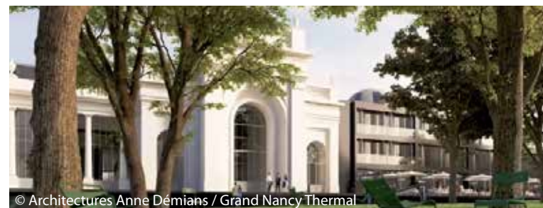
© Architectures Anne Démians / Grand Nancy Thermal