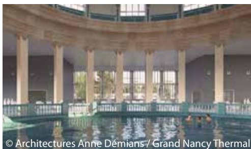
© Architectures Anne Démians / Grand Nancy Thermal