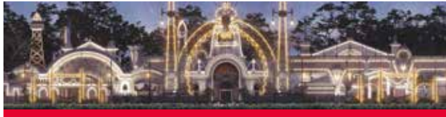
DESTINATION NANCY, destination innovante

L'Ecole de Nancy a été un exemple en termes d'innovation, d'audace et de créativité au début du XXème siècle. DESTINATION NANCY s'inspire aujourd'hui de cet état d'esprit ainsi que de cette volonté de modernité et de renouvellement pour valoriser, grâce à ses nouveautés, l'Art Nouveau auprès des publics.