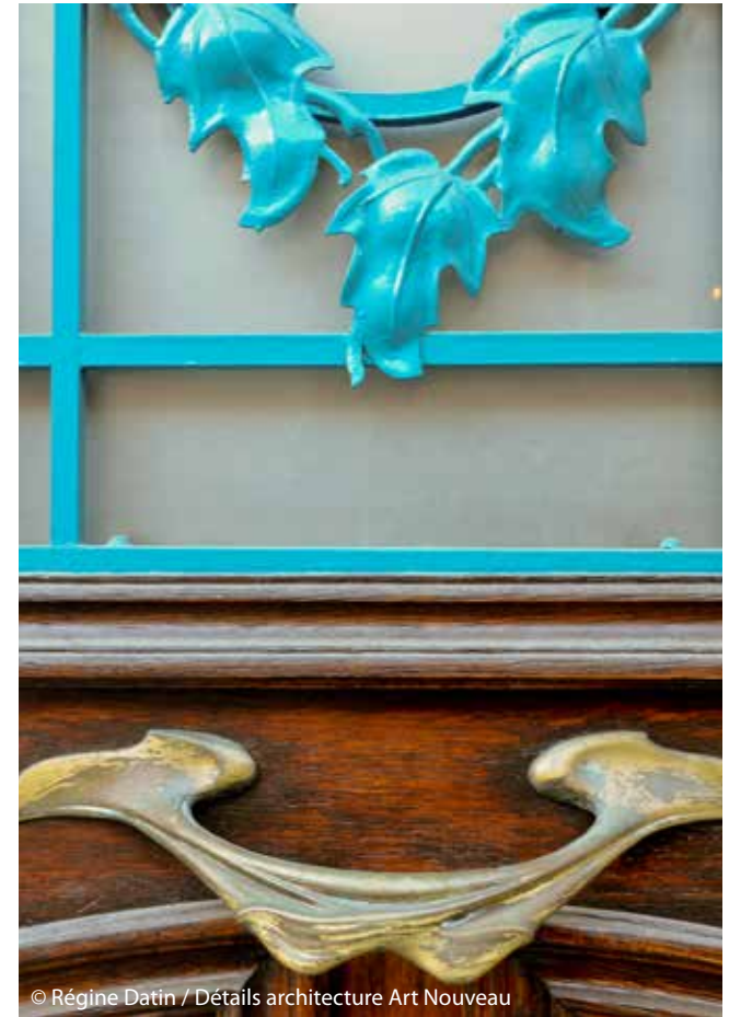
Détails architecture Art Nouveau