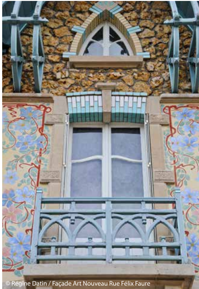
Façade Art Nouveau Rue Félix Faure