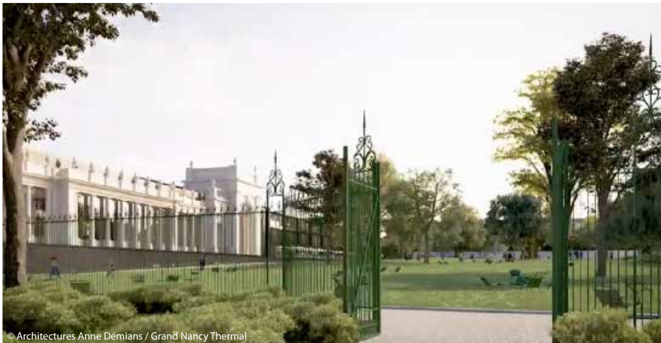
© Architectures Anne Démians / Grand Nancy Thermal