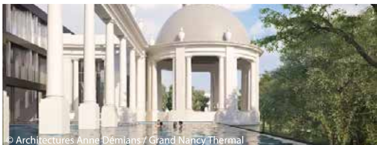
© Architectures Anne Démians / Grand Nancy Thermal

Places limitées, inscription sur www.grandnancythermal.fr