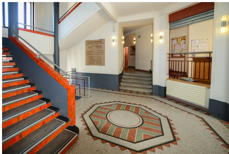
Cité U Monbois

Université - C'est à cette époque que furent créés de nombreux bâtiments universitaires, parmi lesquels le foyer étudiant du GEC (1926 à 1931), l'institut de formation aux soins infirmiers (1930), la faculté de pharmacie (conçue dans les années 1930 mais achevée en 1951), la cité universitaire Monbois (1932), la bibliothèque de la faculté de droit (1932 à 1939) ; la faculté de chirurgie dentaire (1932), la bibliothèque de l'ancienne faculté de pharmacie (1934).