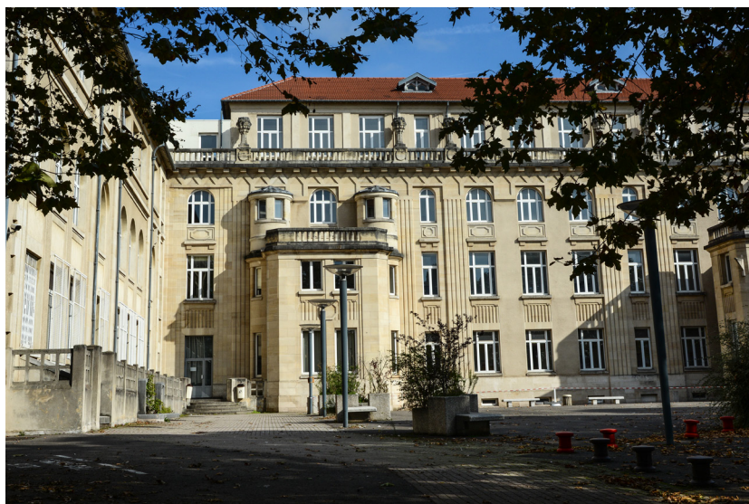
Lycée Paul Louis Cyfflé