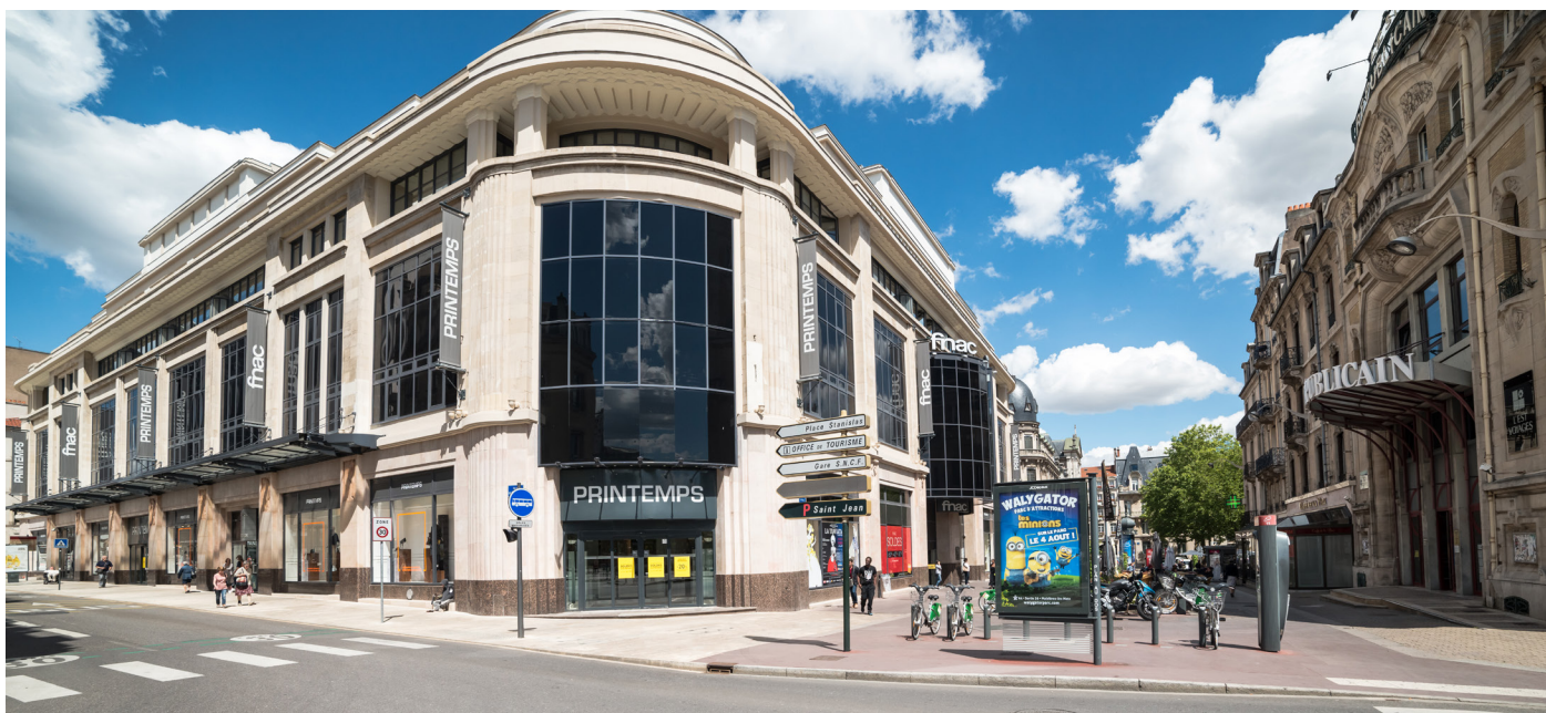
Anciens Magasins Réunis – Crédits : Régine Datin

Magasins Réunis – L'un des bâtiments Art déco les plus emblématiques de la ville de Nancy, aujourd'hui sous l'enseigne Printemps-Fnac. A l'origine de style Art nouveau, il est reconstruit après l'incendie de 1916 selon les souhaits de son directeur Eugène Corbin, qui confie sa réalisation à l'architecte Pierre Le Bourgeois. Inauguré en 1928, ses frises en corniche et ses bas-reliefs en façade sont typiquement Art déco.