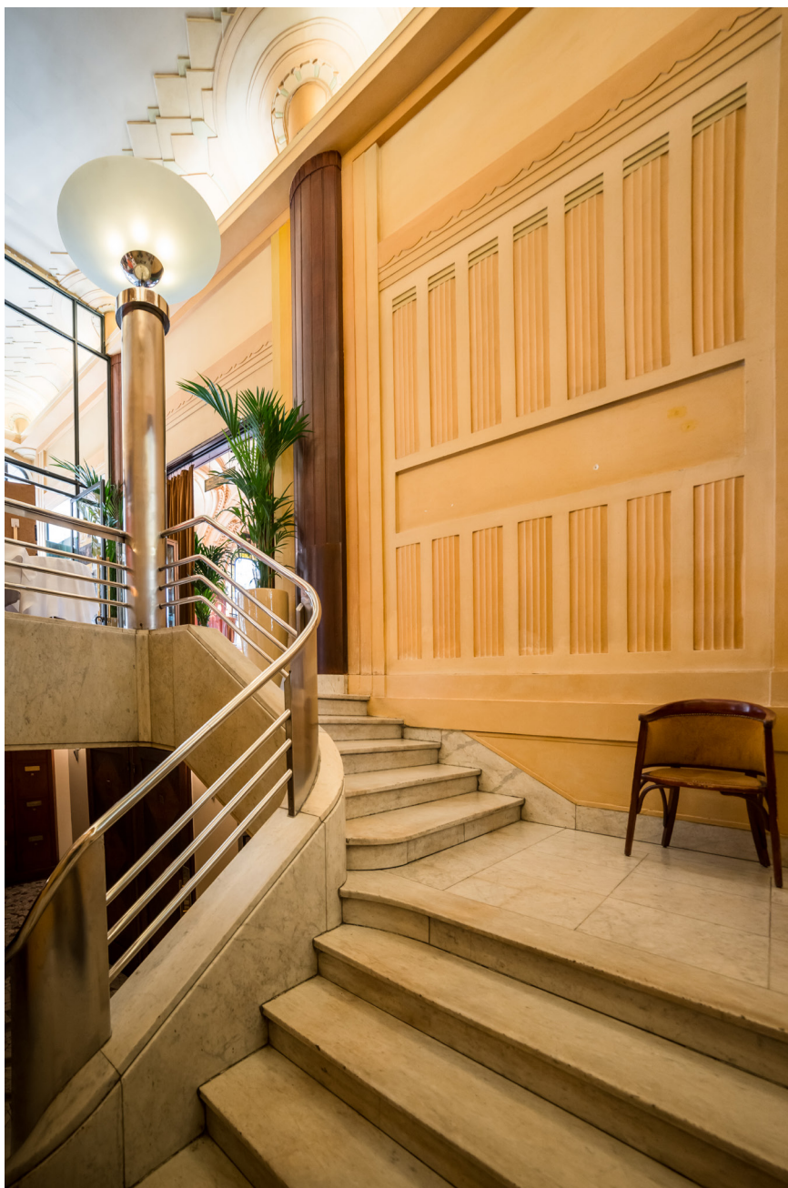
Escalier et luminaire Prouvé à la brasserie de l'Excelsior

Prouvé (Jean) - Fils de Victor Prouvé. Autodidacte et avant-gardiste, il fut d'abord ferronnier dans les années 1920 et travailla sur de nombreux bâtiments Art déco. Il se tourna ensuite vers l'ingénierie, l'architecture et la conception de mobilier, en privilégiant l'utilisation du métal et en concevant ses réalisations selon une approche industrielle, reproductible et facilement assemblable pour un coût modéré. Symbole de la reconnaissance de son génie, il fut nommé président du jury de concours d'architecte du Centre Pompidou en 1971.