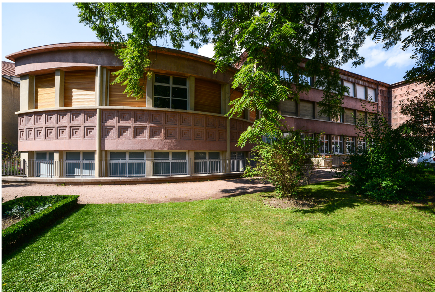
Muséum-Aquarium de Nancy

Zoologie et son institut - L'actuel Muséum Aquarium de Nancy, conçu par les frères Jacques et Michel André. Pour sa construction, ils choisirent un style et un procédé de construction avant-gardiste conçu par Frank Lloyd Wright, avec qui ils ont correspondu.